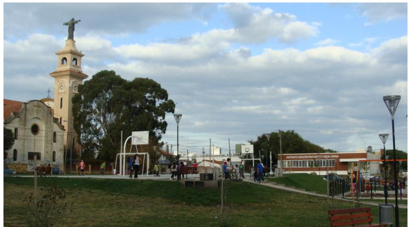
Fig. 3- Vista de la Iglesia La Sagrada Familia y Distrito Descentralizado del Puerto desde la plaza ubicada enfrente a la Vieja Usina