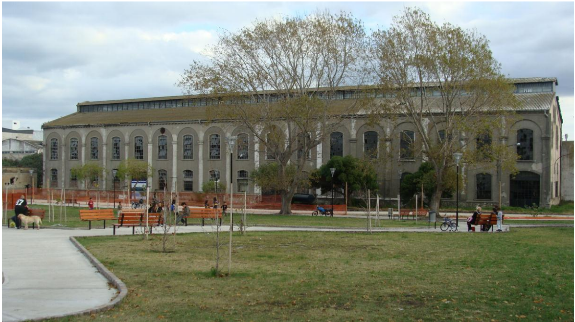
Fig. 1- Vista de la fachada principal de la “Vieja Usina” desde la plaza

espacio interior, las grandes fachadas con su tratamiento del revoque y ornamentos, las piezas de hierro del sistema de arquitectura industrial, la memoria de las chimeneas y tanques que ya no están y todo aquello que jerarquizara las propuestas en el aspecto histórico y patrimonial. Se recomendó restaurar los sistemas de descarga pluvial incluyendo cubierta, fachada, conductos y cámaras. Se estimó que los proyectos que consideren incorporaciones de nuevos elementos arquitectónicos debían ser respetuosos en el dialogo con lo existente, preservando las cualidades estéticas y constructivas del edificio.