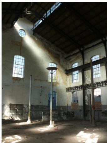
Fig. 2- Vista interior de la Usina